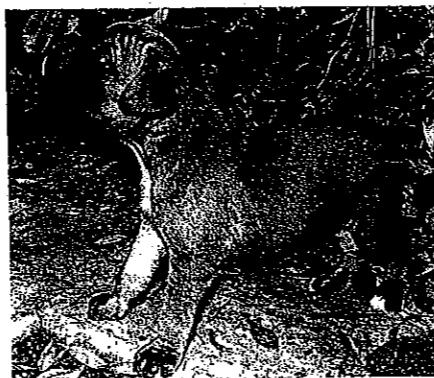
Il cucciolo deve entrare in contatto con il maggior numero di stimoli possibile, avendo cura di farlo in modo graduale e evitando luoghi o situazioni rischiose.

Occorre metterli in contatto con il maggior numero di stimoli possibile