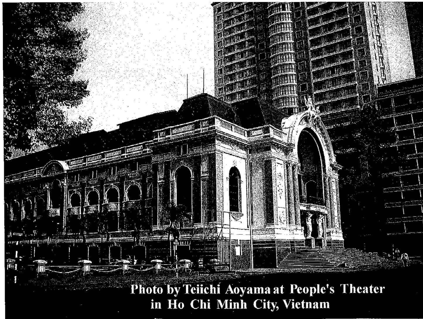
Photo by Teiichi Aoyama at People's Theater in Ho Chi Minh City, Vietnam